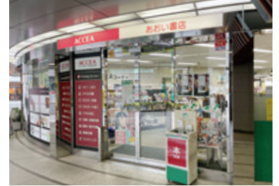
アクセア (株アクセア)