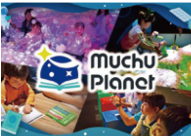
ムチュウプラネット (株リトブラ)