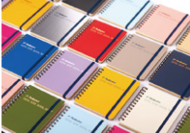
(株)デルフォニックス