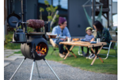
ファイヤーサイド(株)