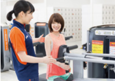
スポーツクラブアクトスWill_G (株アクトス)