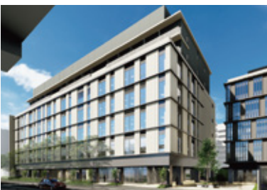
トーハン本社跡地再開発