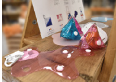
(株)マリモクラフト